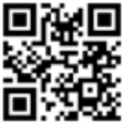
Liberal Democrats (UK) officielle hymne